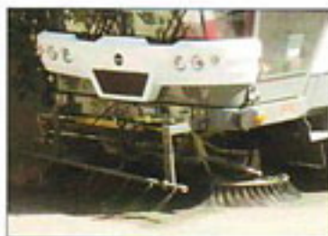
...plus performants. La balayeuse avec option lavage