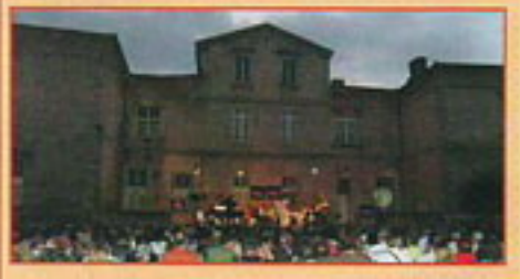
Parterre comble pour l'ouverture dans le parc du Château des Vicomtes