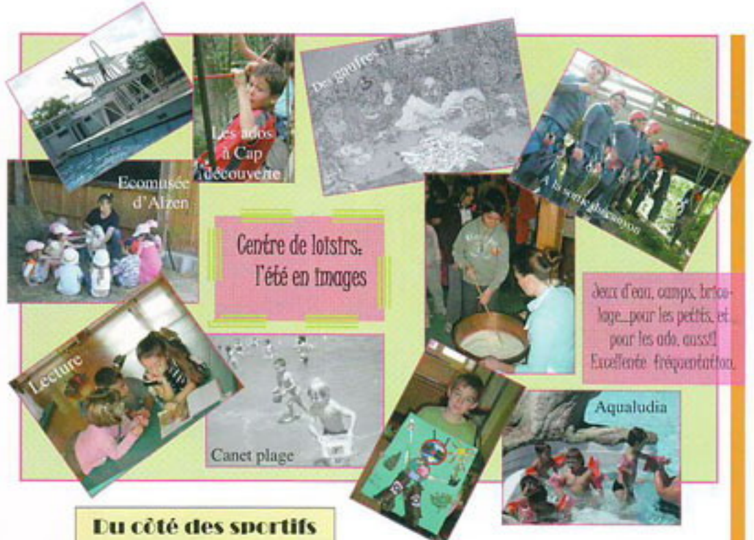
Centre de loisirs. l'été en images

Répondant à des situations critiques, nécessitant un relogement en urgence (incendie ou autres), l'appartement de type T3 mis à disposition par le CCAS rempli d'ores et déjà sa fonction. Encadrée par les services sociaux, cette occupation temporaire, offre la possibilité aux foyers en détresse, d'être tout à la recherche de solutions durables