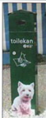
Pour les toutous