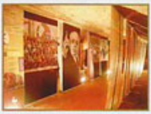
Exposition dans les caves du Château des Vicomtes

Qualité remarquable pour cette première, alliant, concert, exposition arts plastiques lectures et rencontres